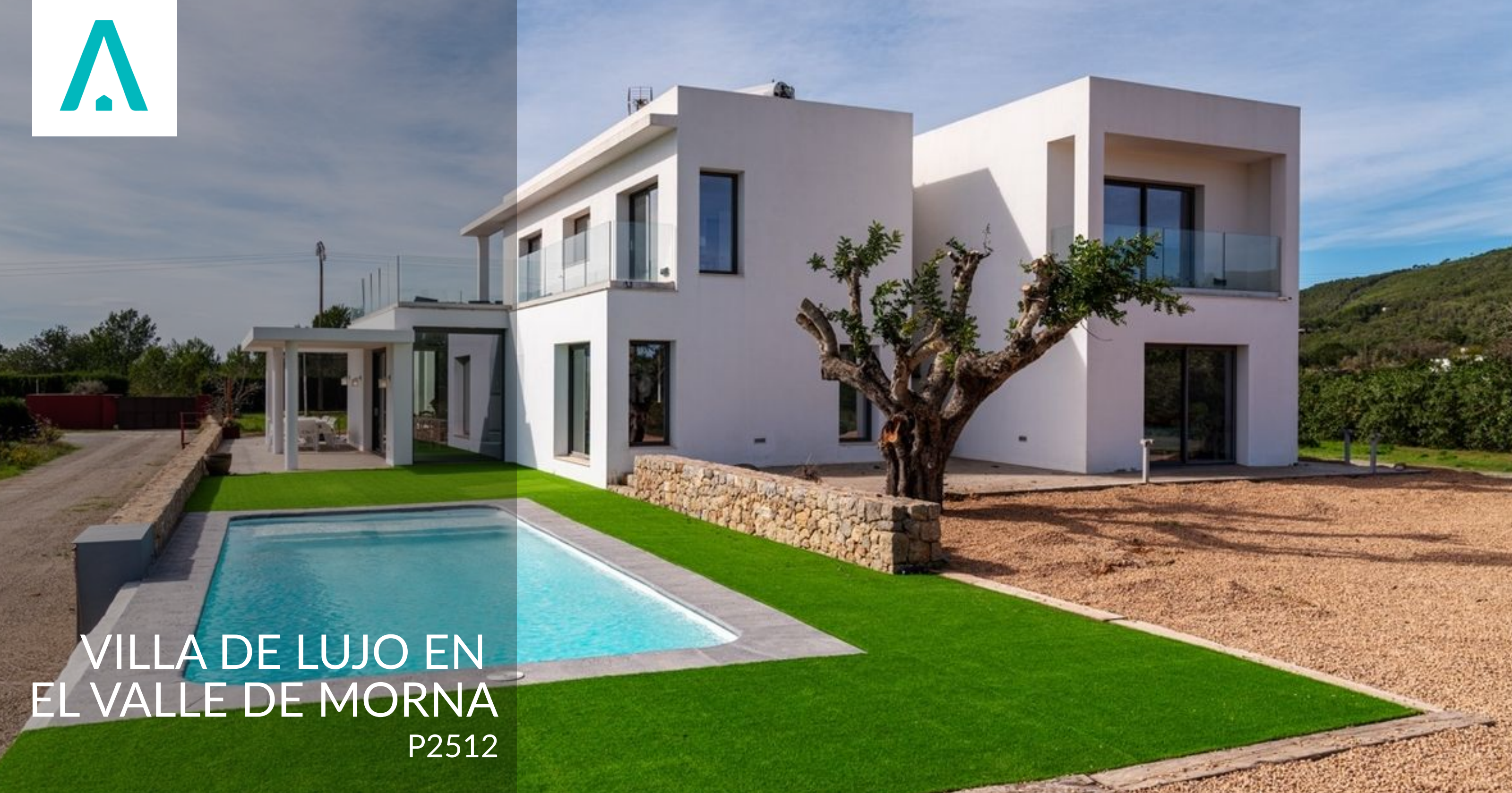
VILLA DE LUJO EN EL VALLE DE MORNA P2512